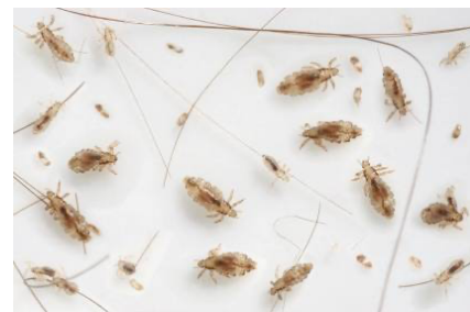
Kopfläuse und Nissen