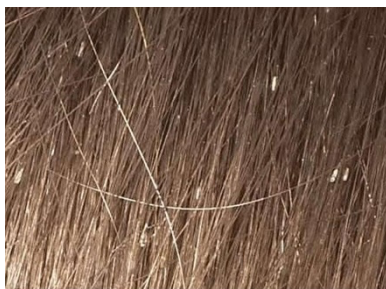
Nissen im Haar

* Wenn Sie nur Nissen finden, kontrollieren Sie jeden Tag die Haare Ihres Kindes. Alle Nissen müssen von Hand entfernt werden. Wenn Sie nach zwei Wochen keine lebenden Kopfläuse finden und die Nissenanzahl nicht zunimmt, können Sie das tägliche Kontrollieren beenden.